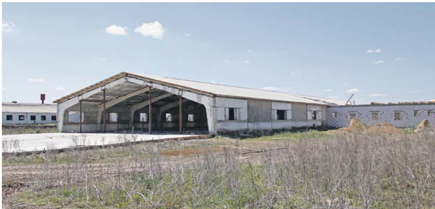
На петропавловской ферме прибавится буренок и работы людям