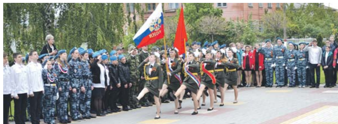
Знаменосцы из Среднего Икорца прошли парадным маршем

Вынос флагов доверили знаменной группе «Гвардии» Среднеикорцевской школы, первой в районе вступившей в ряды юнармии.