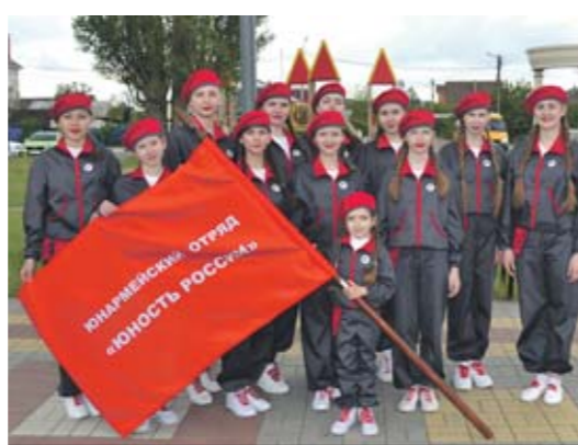
Юнармейцы Второго Сторожевого сами пошили форму