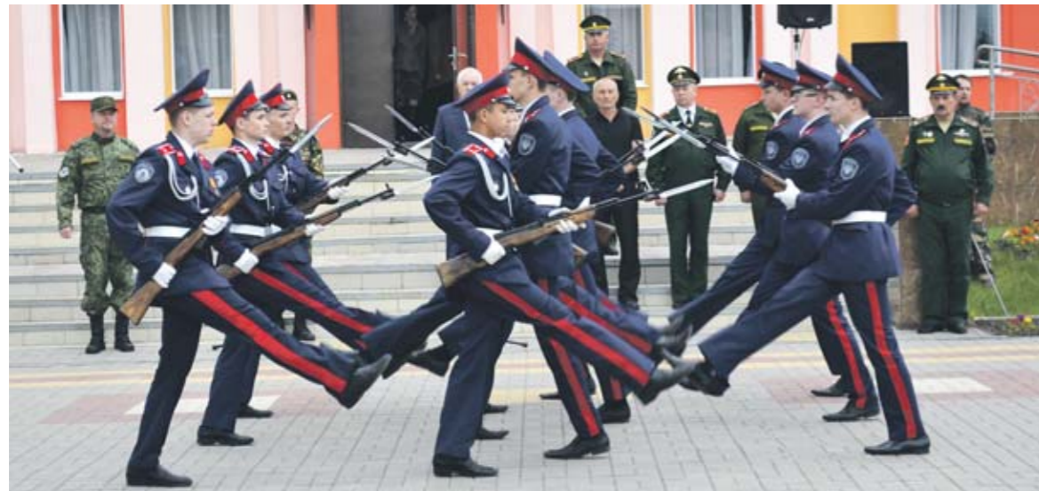
Горожанские кадеты показали образцовую выучку